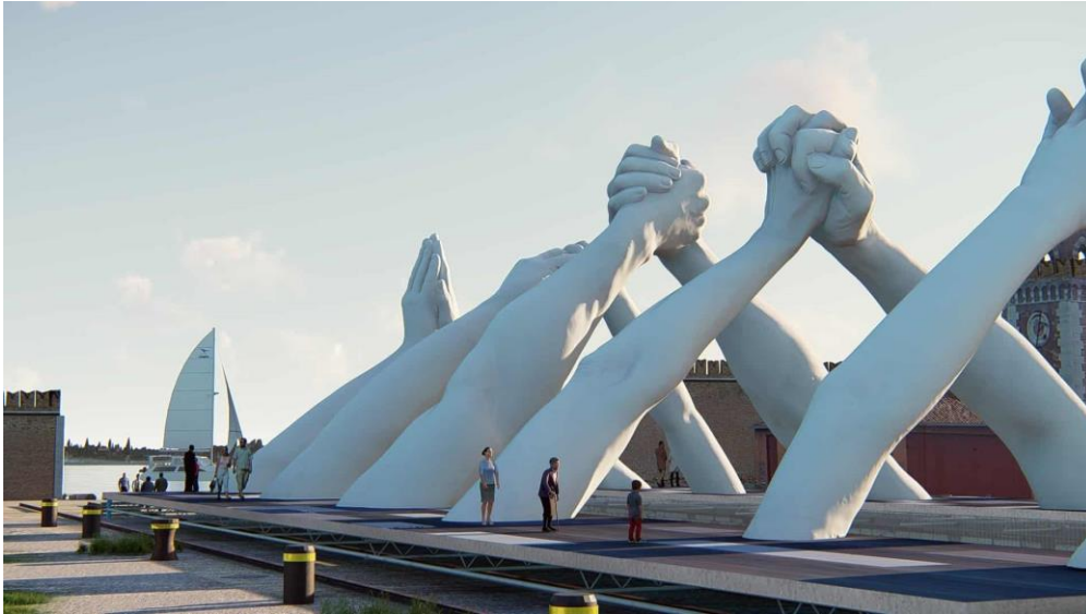
Lorenzo Quinn 58 ste Biënnale Venetië