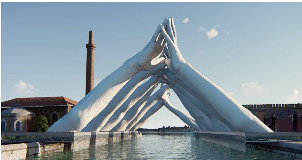
Lorenzo Quinn 58 ste Biënnale Venetië

Solidariteit kan ... betekenen (samen dragen, samen steunen, samen bouwen, samen leven, meeleven, meedelen, ondersteunen, bemoedigen, inzet, verantwoordelijkheid, ...)